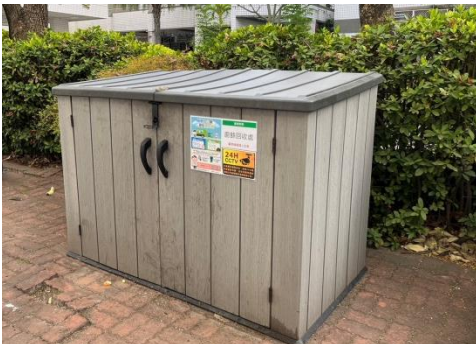
學生活動中心南側 (S 棟)