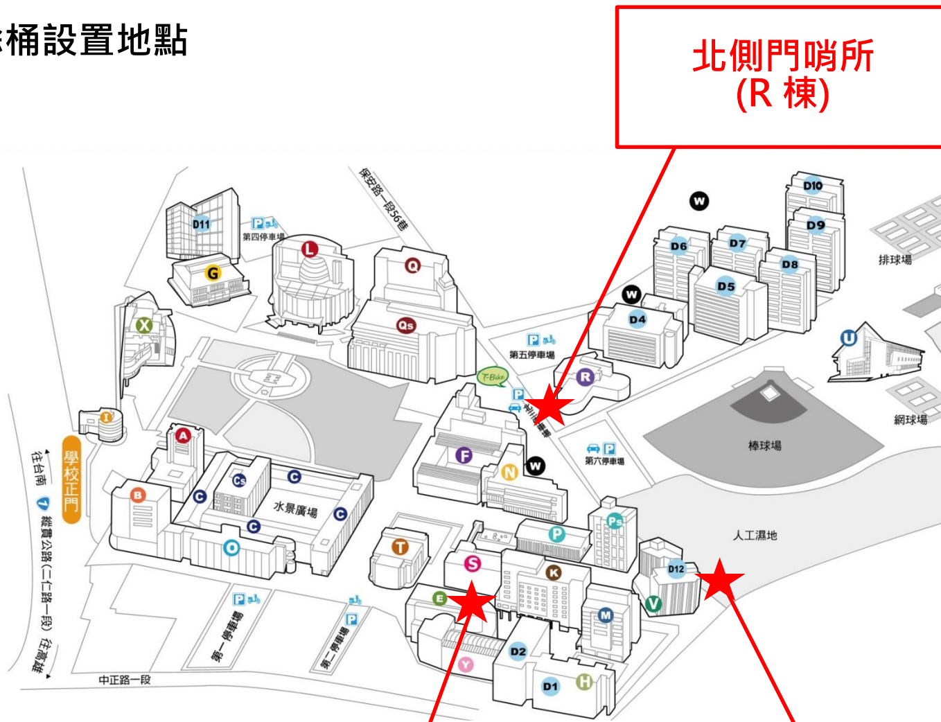
北側門哨所 (R 棟)