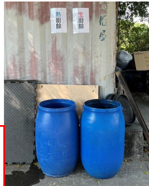
本校垃圾場 廚餘回收區