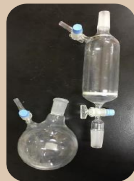
圖1. 過濾器和玻璃瓶

A生於實驗室用硝酸清洗玻璃過濾器，未傾倒使用水及丙酮清洗，使硝酸及丙酮發生反應，導致玻璃瓶內因產生氣體壓力過大而裂開，使化學溶液噴濺至雙眼，欲使用緊急沖淋裝置，其距離超過20公尺且水壓不足。